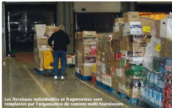
Les livraisons individuelles et fragmentées sont remplacées par l'organisation de camions multi-fournisseurs