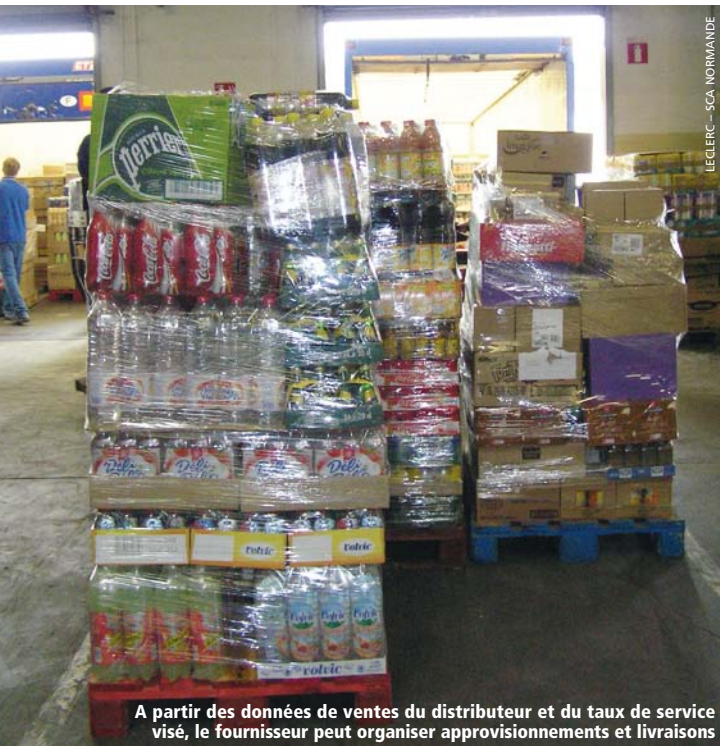
LECLERC - SCA NORMANDE